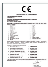
UNE-EN 14428:2016 Parois de bain