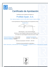
ISO 9001:2015 Système de gestion de la qualité