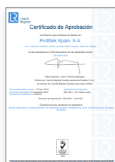
ISO 9001:2015 Système de gestion de la qualité