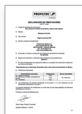
UNE-EN 14428:2016 Parois de bain