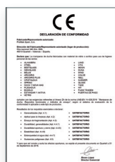
UNE-EN 14428:2016 Parois de bain