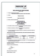
UNE-EN 14428:2016 Parois de bain