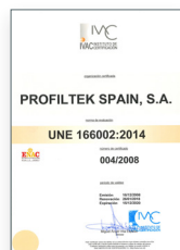
UNE 166002:2014 Gestion de R+D+I